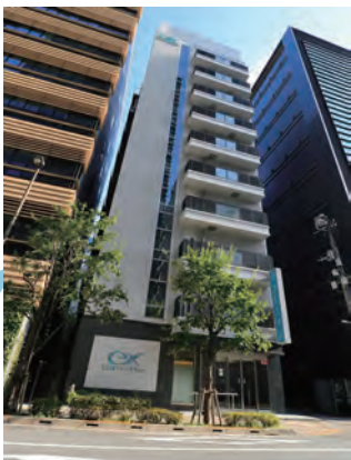
日本農業新聞社ビル

3. 通り沿いをそのまま3~4分ほどまっすぐ進むと信号機があり、 「日本農業新聞社ビル」が正面にあります。 この交差点を右折してください。