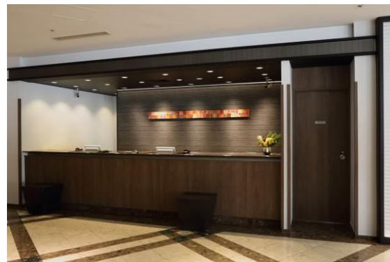
高輪ロビー・フロント (現況)