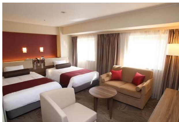
京急EXホテル高輪 デラックスツイン