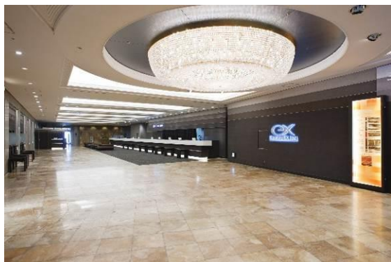
品川ロビー・フロント (現況)